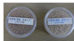
高蛋白質量のパフ (不二製油社製)

蛋白質が不足する高齢者、運動選手の補助食品として、簡便にかつ継続的に摂取でき、保存食としても使用可能な菓子・パンが提供出来ます。